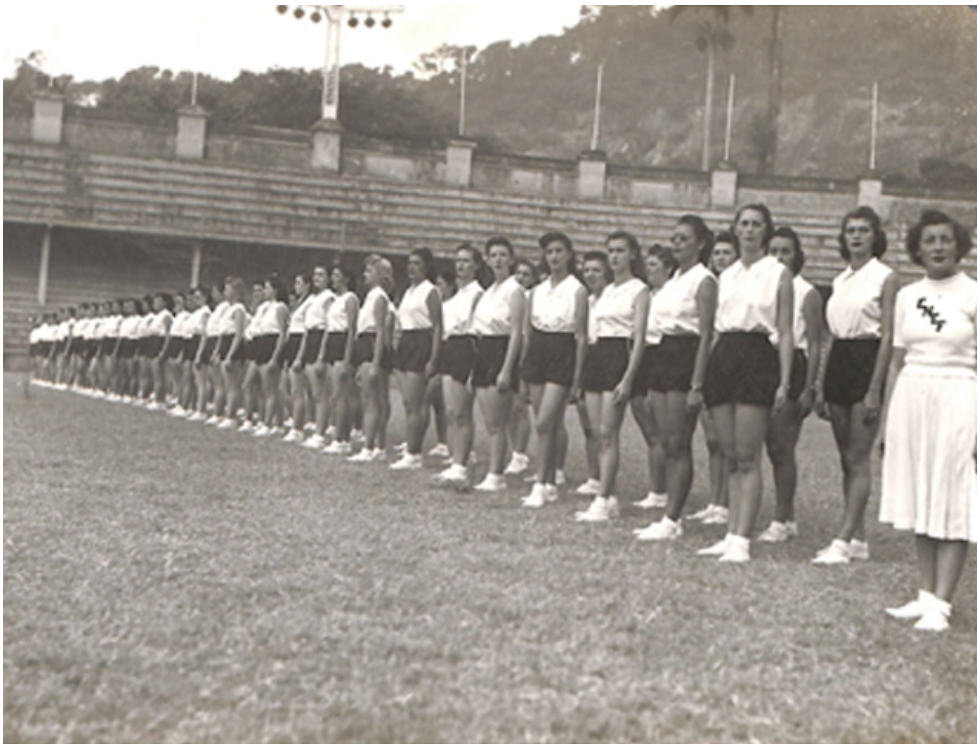
Figura 4 Alumnas en la exhibición Escola Nacional de Educação Física e Desportos (ENEFD) en las instalaciones de Fluminense F.C. (CDH, DNEFDyR 1672, p. 8)

Se destaca la realización de demostraciones separadas por sexo-género, desarrollando hombres y mujeres prácticas corporales diferenciadas, tal como se observa en las fotografías sobre desfiles de alumnos y alumnas. La entonación del himno nacional es un punto a remarcar como refuerzo de la construcción de la identidad local, en tanto ritual que también se llevaba a cabo en los institutos de formación docentes argentinos. Como sostiene Víctor Andrade de Melo (2007), el papel de las políticas del Estado Novo para la construcción de la Educación Física fue fundamental: el régimen autoritario implantado en Brasil por Getúlio Dornelles Vargas, que llegó al poder tras un golpe de Estado el 10 de noviembre de 1937 y se mantuvo en él hasta el 29 de octubre de 1945, fue clave para desarrollar la Escola Nacional de Educação Física e Desportos (ENEFD) de la Universidade do Brasil, fundada el 17 de abril de 1939. En efecto, según este autor, la educación física estaba ligada a un proyecto de seguridad nacional, algo mucho más complejo que simples preocupaciones de una disciplina escolar.