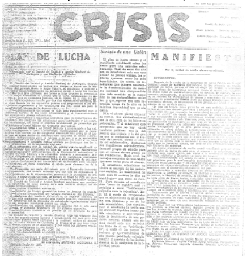
FIGURA 2 Primera página del primer número de Crisis . Año I. #1. Medellín, Julio 1 [no se entiende el número] de 1957.