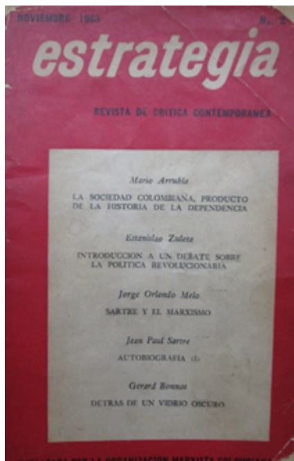
FIGURA 5 Portada de la revista Estrategia . 2. (Noviembre de 1963)

Ahora, el anverso de la revista que estudiamos muestra los manifiestos públicos en los que sus directores evidenciaron la necesidad de distinguirse como un “nosotros” de un “ellos” que inicialmente fue la burguesía y el propio Partido Comunista que creyó en el potencial revolucionario de ella. Pero, poco después, ese “ellos” también estuvo conformado por las corrientes de izquierda que llamaron “aventureras” y “extremistas”, dado