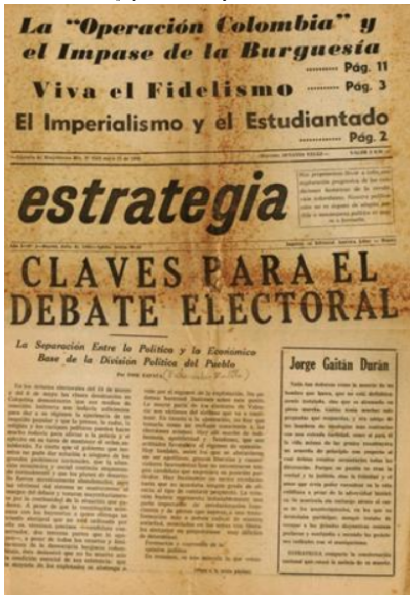
FIGURA 3 Primera página de Estrategia. 1. (Julio de 1962).

“Nos proponemos llevar a cabo una exploración progresiva de las condiciones históricas de la revolución colombiana. Nuestra publicación no es órgano de ningún partido o movimiento político ni aspira a formarlo”. Con este epígrafe sale a la luz el primer número en la forma de periódico. Son dieciséis páginas en tamaño cuarto de pliego en cuya portada se ofrece un amplio título que reza: “Claves para el debate electoral” y en un recuadro más pequeño y lateral un obituario al intelectual Jorge Gaitán Durán (1924-1962), fundador de la revista Mito , la más importante publicación cultural del país hasta ese momento.