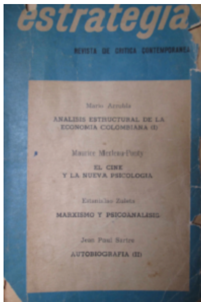
FIGURA 6 Portada de la revista Estrategia . 3. (Enero de 1964)